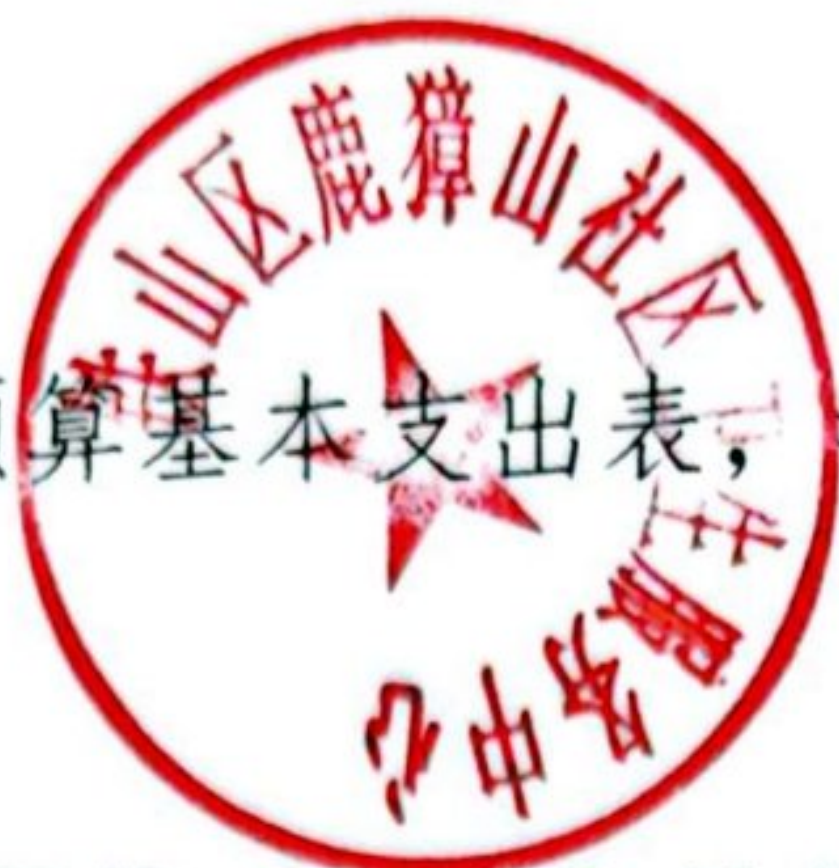
表6 一般公共预算基本支出表，我单位无此项内容，本表无数据。